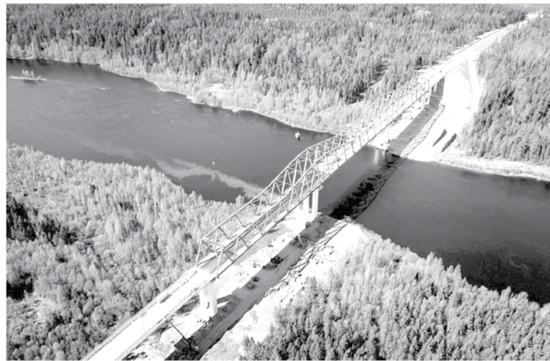
Строительство моста через реку Свирь стало историческим событием

Классификация книг такая: во-первых, всегда в ходу что-то лёгкое, например, детектив или авантюрный роман. Во-вторых, обязательно читаю какой-нибудь исторический труд. Недавно, например, в оригинале прочитал труды Ломоносова, сейчас читаю много об истории российской государственности — целыми сериями книг. В-третьих, люблю научно-популярные книги — будь то социология, культура или даже физика. Стараюсь изучать эти темы глубоко: ино-