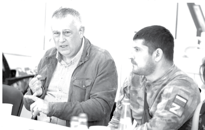
Александр Дрозденко на встрече с участниками и ветеранами СВО

шие перспективы вижу в привлечении ветеранов к воспитательной и патриотической работе — ждём их в качестве преподавателей в наших центрах «Авангард» и «Молодёжный». Не обязательно учить молодёжь именно военному делу — просто воспитывать их патриотами, рассказывать об истории и культуре, прививать любовь к спорту.