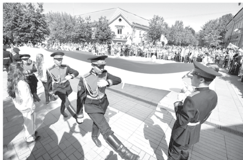
Патриотизм и взаимоподдержка объединяют ленинградскую семью

— Мы провели очень важное мероприятие для России — съезд молодых учителей со всей страны. Этот съезд проходил в Гатчине уже в четвёртый раз, и все воспринимают его как наше, ленинградское событие. Отмечу работу со школами — в них появляются IT-клубы, кванториумы, образование становится более цифровым и современным. В регионе активно открываются молодёжные