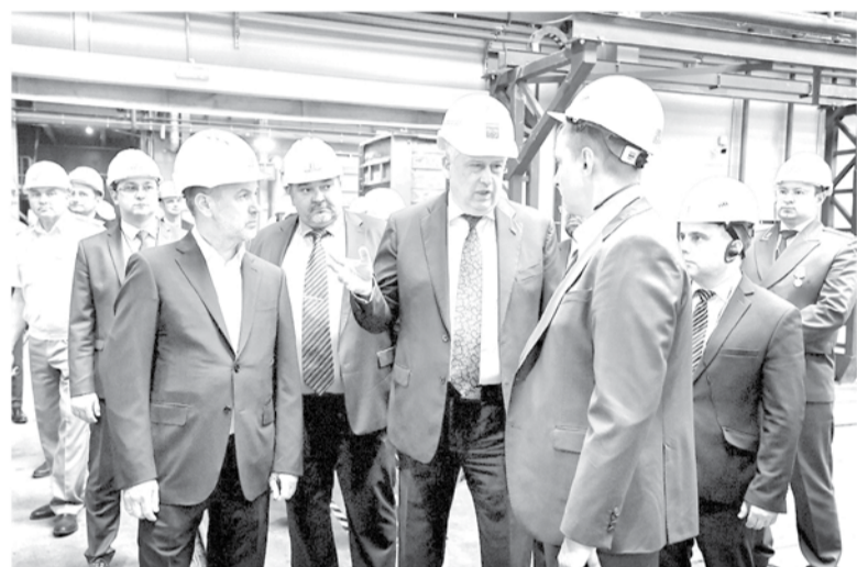
Ленинградская промышленность наращивает обороты несмотря на санкции

— Мы, наверное, единственный регион, где уже работают три отделения федерального фонда «Защитники Отечества» — во Всеволожске, Выборге и Гатчине. Скоро будем открывать ещё один — либо в Луге, либо