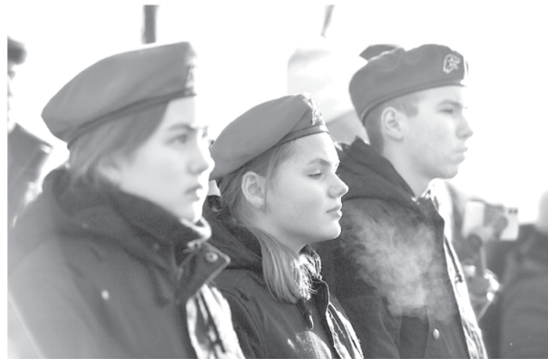
В регионе открываются новые центры военно-патриотического воспитания