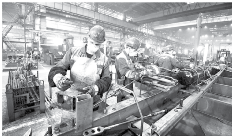
Безработица в регионе стремится к нулю, предприятиям нужны квалифицированные специалисты

— Вообще-то я считаю, что Ленинградская область обре-