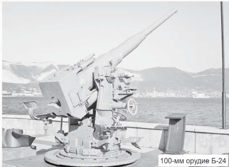
100-мм орудие Б-24